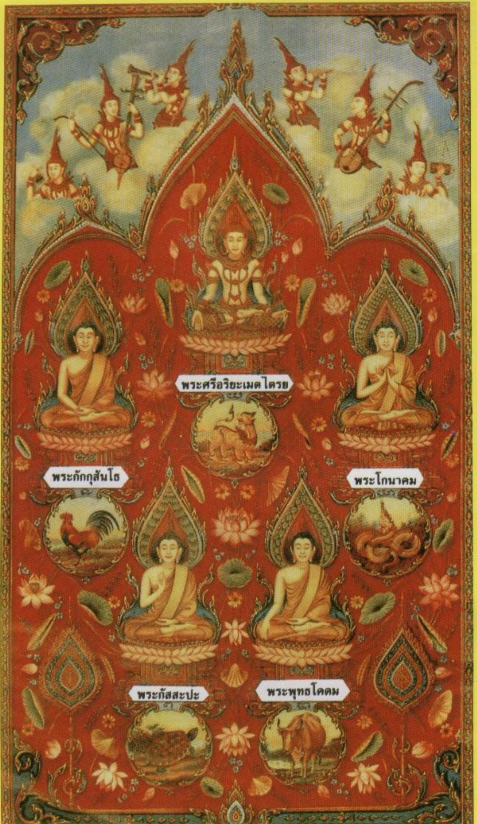
พระศรีอริยเมตไตรย