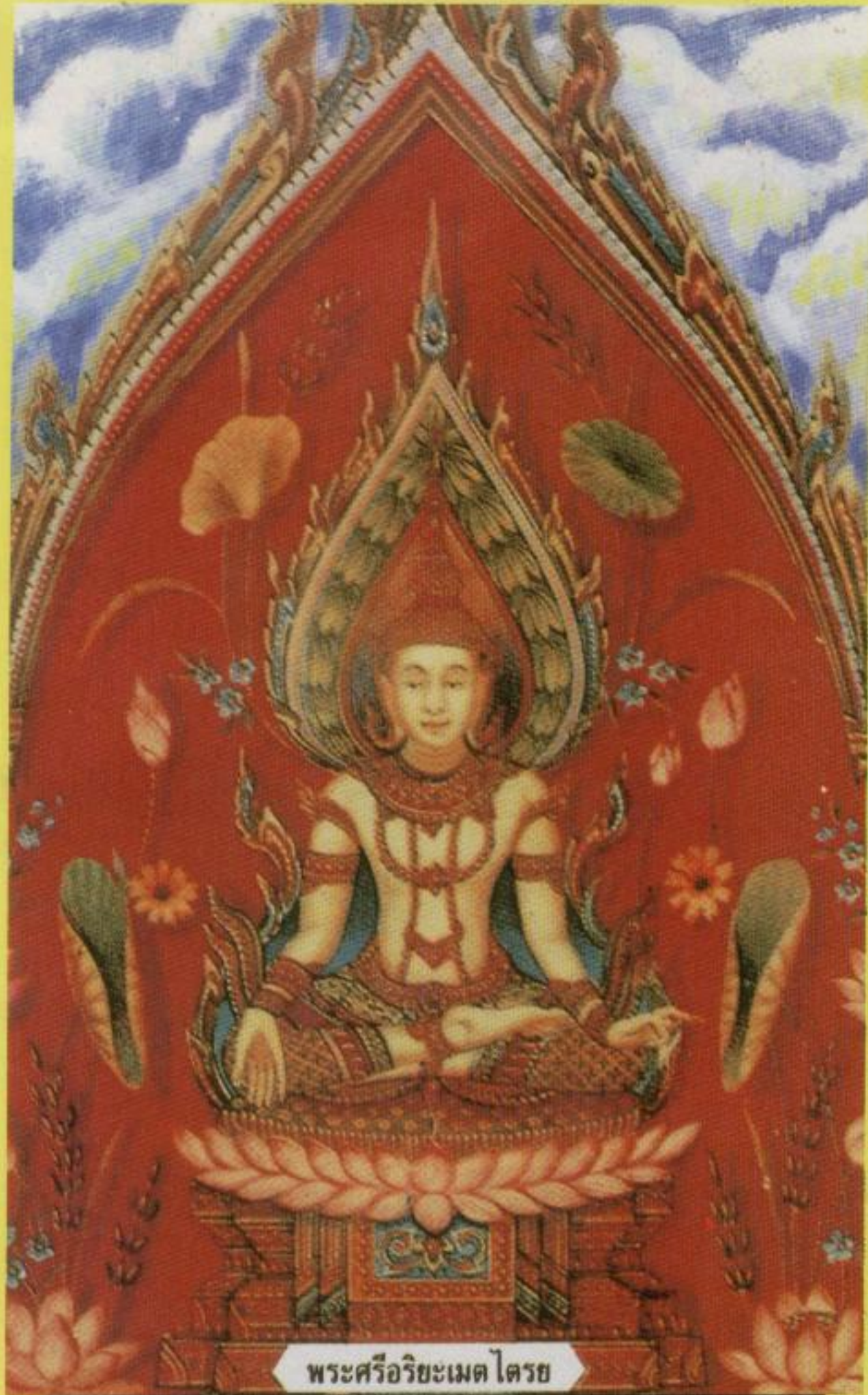
พระศรีอริยะเมตไตรย